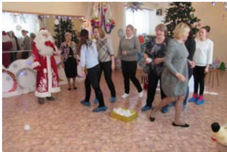
Участие родителей группы «Сорока-белобока» в празднике

Считаю, что моему сыну повезло с такими замечательными педагогами.