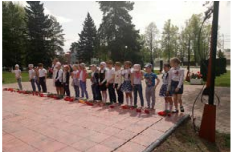
Совместный праздник старших групп «Сорока-белобока» и «Колосок»