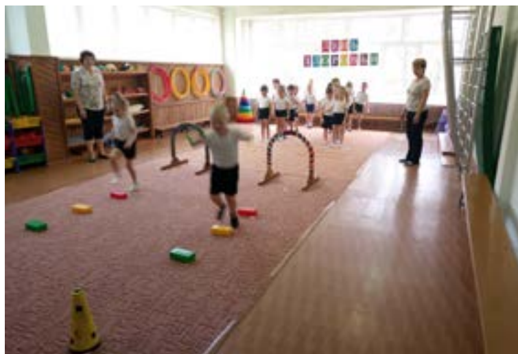
Занятие физической культурой

Предлагаются рекомендации для родителей по организации двигательной активности дошкольников и созданию оптимальных условий.