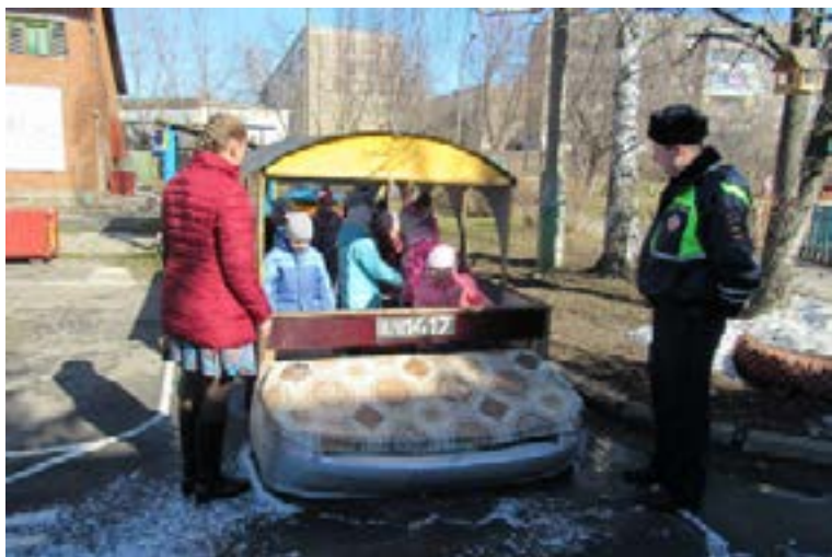
Старшая группа «Сорок-белобока»

Дети с удовольствием общались с сотрудниками ОГИБДД, отвечали на вопросы, рассказывали об историях на дороге из их реальной жизни.