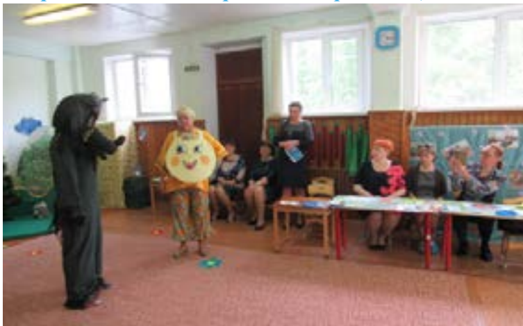
Деловая игра «Редакция электронного журнала «Сказочная планета»