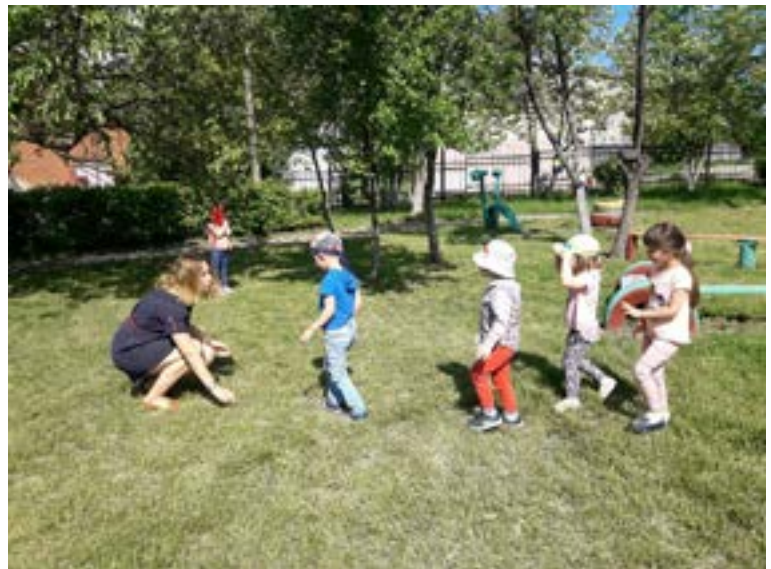
Подвижная игра «Лиса в курятнике»

На одной стороне площадки отчерчивается курятник. В курятнике на насесте (на скамейках) располагаются куры, дети стоят на скамейках. На другой стороне площадки находится нора лисы. Все остальное место – двор.