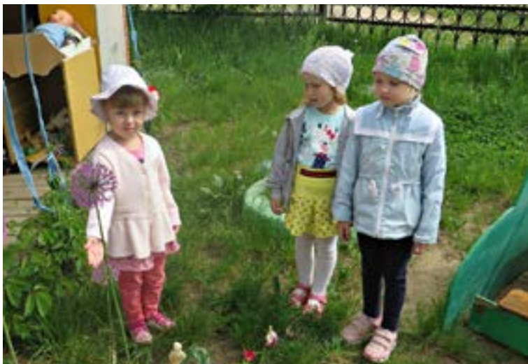
Воспитанники средней группы «Звёздочка»

Для чего на улице деточкам гулять? Чтобы щёчки на лице солнцу подставлять. Чтобы бегать как зверушки и как птички щебетать. Чтоб в любимые игрушки на веранде поиграть. (Батый Ирина)