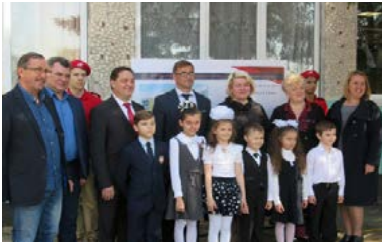
Торжественная церемония закладки капсулы