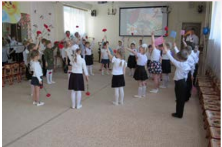
Танец с цветами