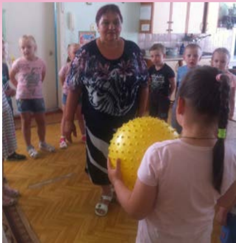
Воспитанники старшей группы «Сорока-белобока»

На все вопросы в игре можно отвечать только словами «да» или «нет». Ребёнок загадывает какое-либо животное (растение). Вы спрашиваете, где живёт это животное, какое оно, чем питается. Ребёнок должен отвечать