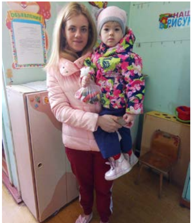
Акция «Добрая крышечка»