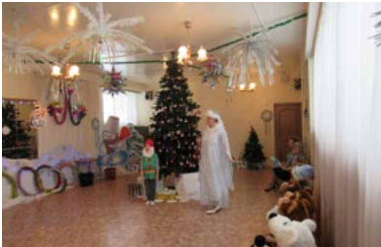
Роль гномика на новогоднем празднике

Всё было хорошо организовано, подготовлено, отрепе-