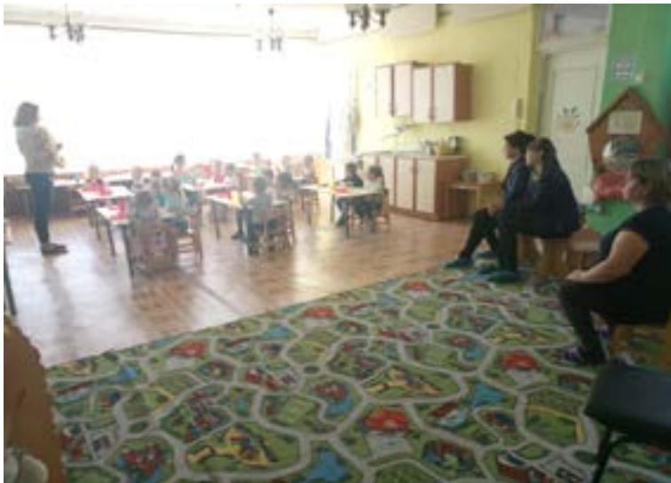
Младшая группа «Заинька»