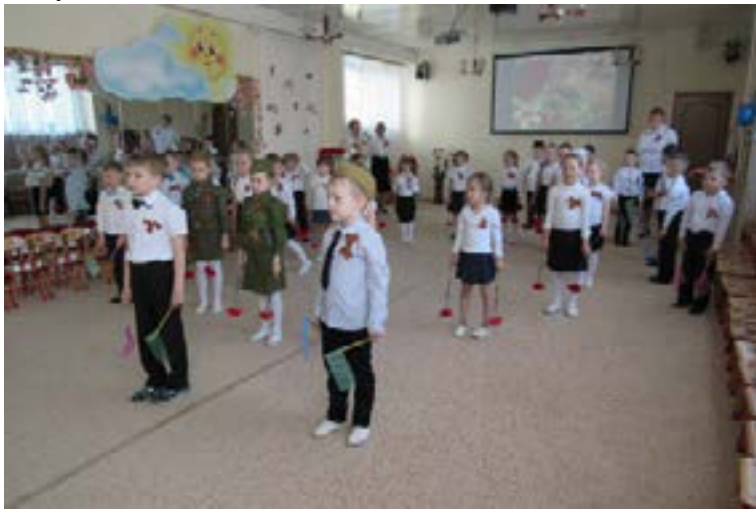
Совместный праздник старших групп «Сорока-белобока» и «Колосок»