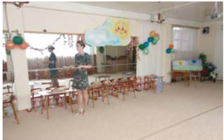
МБДОУ детский сад № 15 «Светлячок», Коломенского городского округа представили свой опыт работы в данном направлении