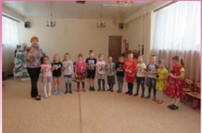
Играют на музыкальных инструментах

Спасибо Вам за это огромное! С такими воспитателями наши дети точно вырастут хорошими людьми и всесторонне развитыми личностями.