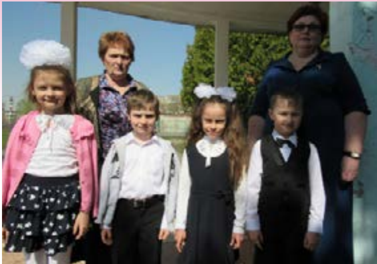
В МБОУ СОШ № 3

25 апреля 2019 года воспитанники нашей образовательной организации подготовительных к школе групп «Гнёздышко» и «Ягодка» приняли активное участие в торжественной церемонии закладки капсулы, свидетельствующей о начале строительства новой пристройки к МБОУ СОШ №3.