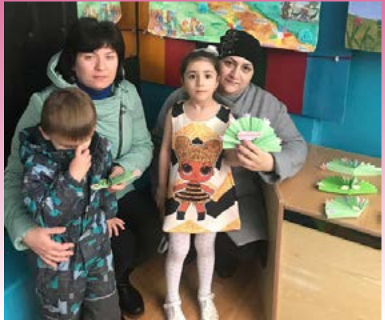
Возьми в дорогу пожелание

Также наша образовательная организация активно приняла участие в акции «Добрая крышечка», где воспитатели и родители каждой возрастной группы смогли поучаствовать.