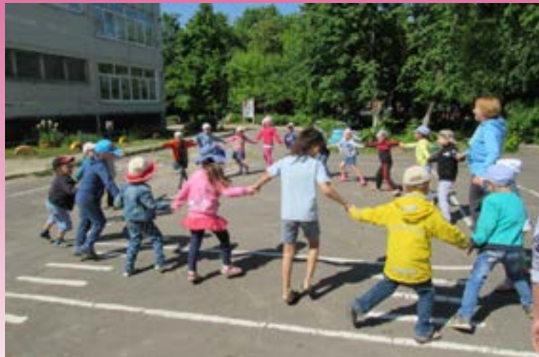
Игры на улице

Важным направлением физического воспитания служит формирование у детей достаточной двигательной активности.