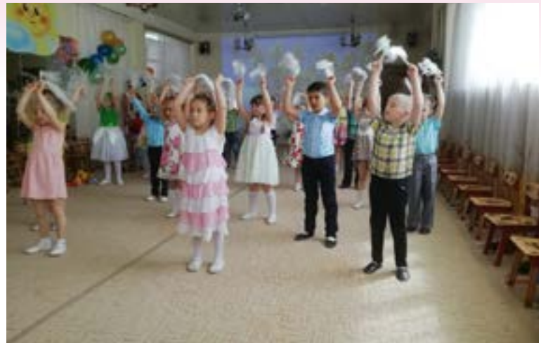
Танец в исполнении воспитанников старших групп