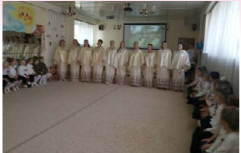
Песня в исполнении педагогов МБДОУ ЦРР - детского сада № 5 «Сказка»