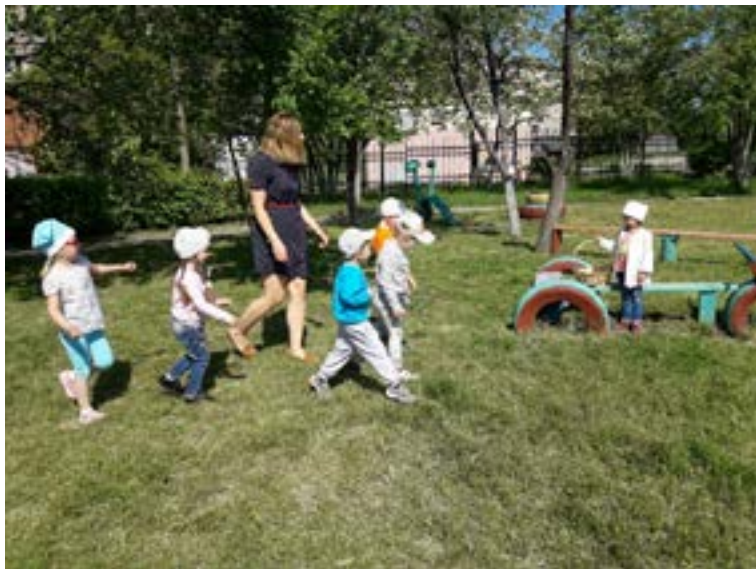
Подвижная игра «Повар и котятя»

Цель: упражнять в различных видах ходьбы и бег, развивать быстроту реакции, умение ориентироваться на