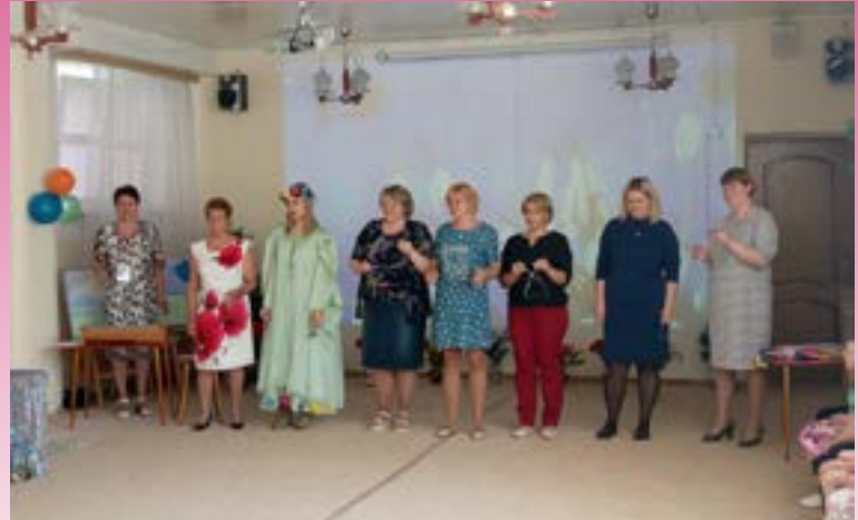
Родители старшей группы Сорока-белобок