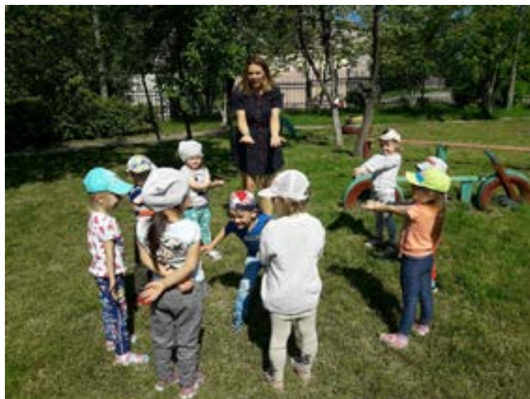
Подвижная игра «Береги руки!»

Дети должны быстро спрятать руки за спину. Те, кого коснулся водящий, выбывают из игры.