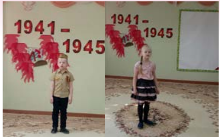
Чтение стихотворений воспитанниками старшей группы «Сорока-белобока»

Воспитанники старшей группы «Сорока белобока» приняли активное участие в конкурсе и заняли почётное второе и третье место в номинациях «За патриотизм» и «За искреннее и проникновенное исполнение стихотворения».