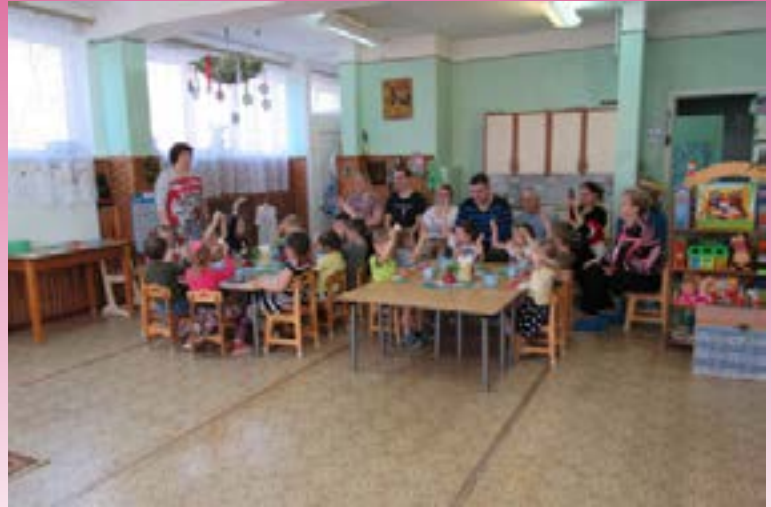
Средняя группа «Звёздочка»

Совместно с учителем - логопедом провела консультацию по теме: «Плюсы и минусы телевизора и компьютера».