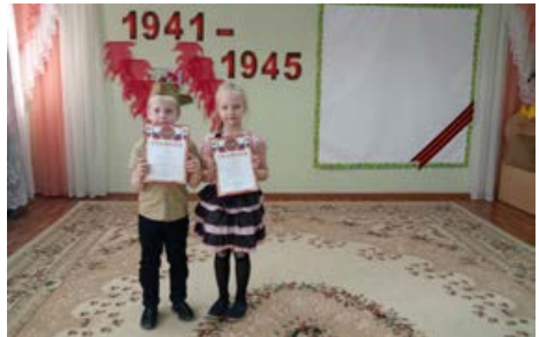
2 и 3 место в конкурсе чтецов