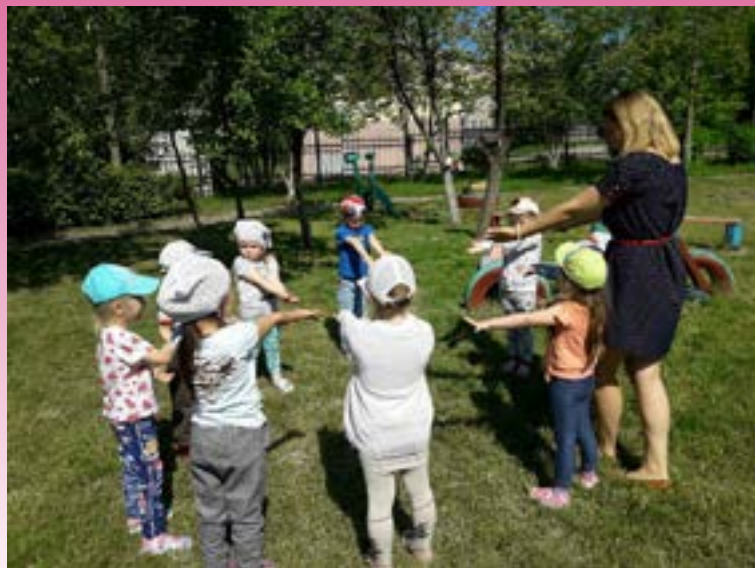
Подвижная игра «Береги руки!»

По сигналу «Береги руки!» - ведущий старается коснуться ладоней играющих.