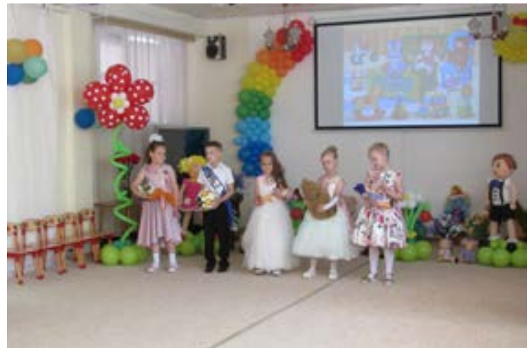
Выпускной праздник «Путешествие на воздушном шаре»