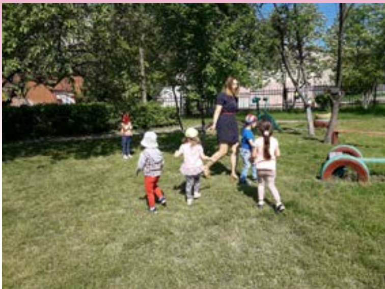
Воспитанники младшей группы «Зайка»

По сигналу «Лиса» куры убегают в курятник, взбираются на насест, а лиса старается утащить курицу, не успевшую взобраться на насест. Отводит ее в свою нору. Куры спрыгивают с насеста и игра возобновляется.