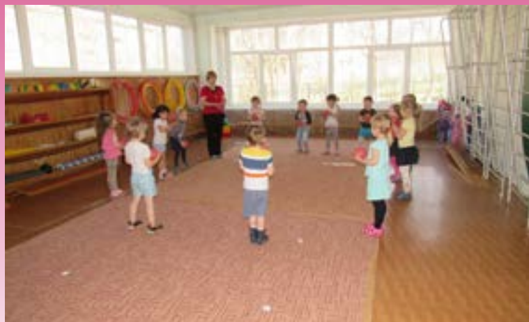
Подвижная игра с мячом

Сон восстанавливает деятельность нервной системы. Для детей раннего и дошкольного возраста физиологически полноценный сон составляет основу крепкого