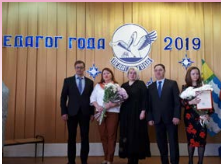
Награждение участников конкурса

29 марта 2019 года в МБОУ гимназии №4 прошла торжественная церемония награждения участников муниципального конкурса «Педагог года Озёры - 2019».