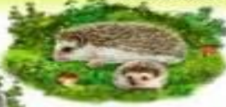
ЕЖ И ЕЖОНОК