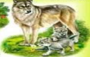
ВОЛК И ВОЛЧОНОК