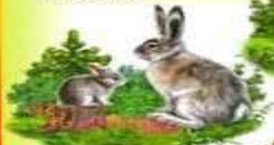
ЗАЯЦ И ЗАЙЧОНОК