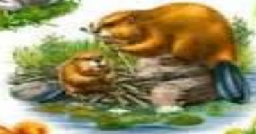
БОБР И БОБРОНОК