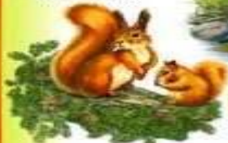
БЕЛКА И БЕЛЧОНОК