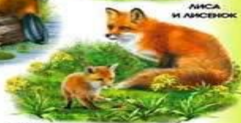
ЛИСА И ЛИСЕНОК