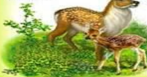
ОЛЕНЬ И ОЛЕНЕНОК